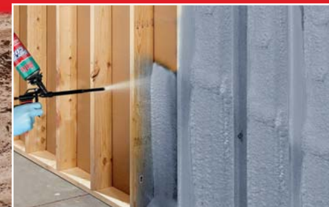
OSB DUVAR YALITIMI