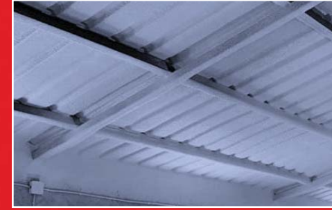
TRAPEZ SAC YALITIMI