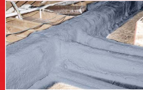
HVAC SİSTEM YALITIMI